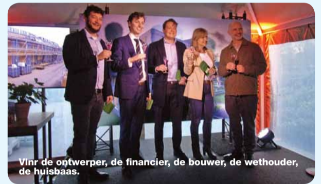
Vinr de ontwerper, de financier, de bouwer, de wethouder, de hujsbaas.

In een grote, goed verwarmde tent werd de openingshandeling verricht. Daarvoor hadden alle betrokkenen hun verhaal mogen vertellen en de wethouder had gewezen op het belang van doorstroming en woon carrière. Waarna iedereen het glas hief op de goede afloop en twee dames hapjes gingen ronddelen. Ongetwijfeld bleef het nog lang gezellig in de tent. ■