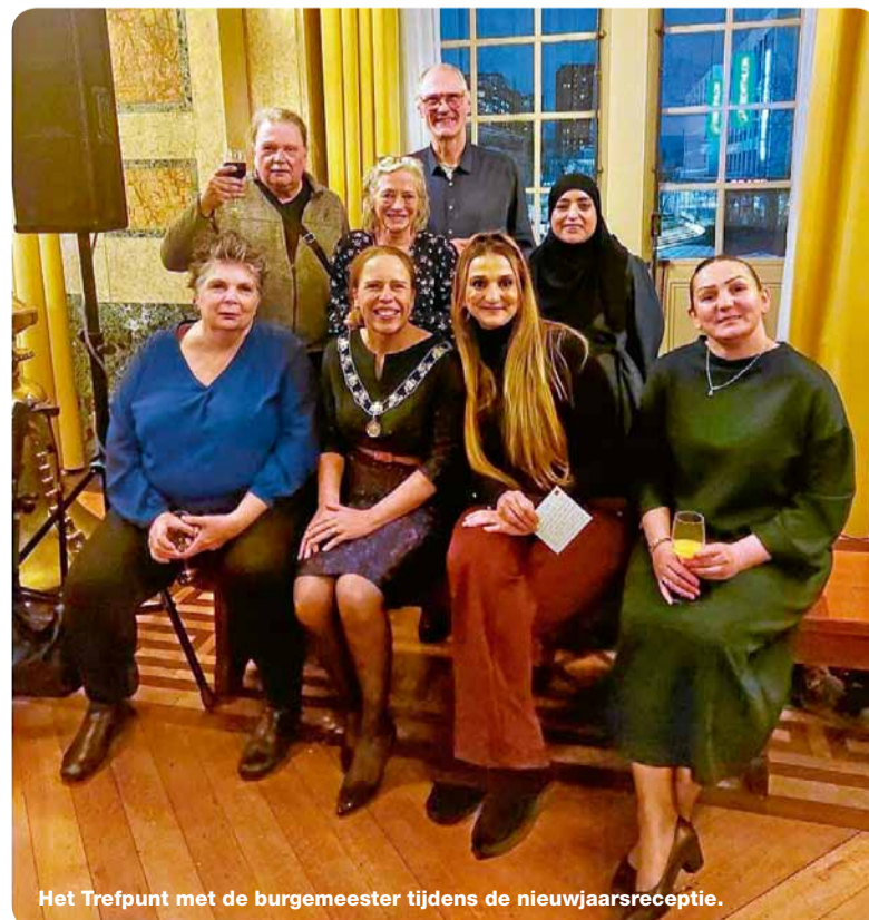
Het Trefpunt met de burgemeester tijdens de nieuwjaarsreceptie.

Kijk op www.rotterdam.nl/verkiezingen voor meer informatie.