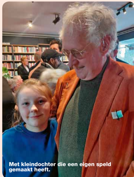
Met kleindochter die een eigen speld gemaakt heeft.

De zilveren Erasmusspeld toont de beeltenis van de beroemdste Rotterdammer ooit: filosoof en humanist Desiderius Erasmus. ■