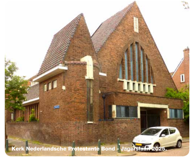
Kerk Nederlandsche Protestante Bond - Jagerslaan, 2025.