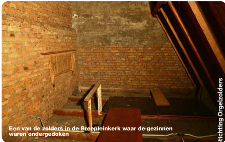
Een van de zolders in de Breepleinkerkerk waar de gezinnen waren ondergedoken

hielp bij de bevalling van de schoondochter van een van de onderduikende families. Geen