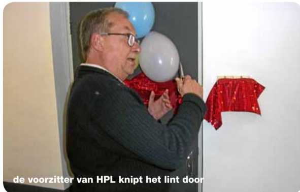
de voorzitter van HPL knipt het lint door