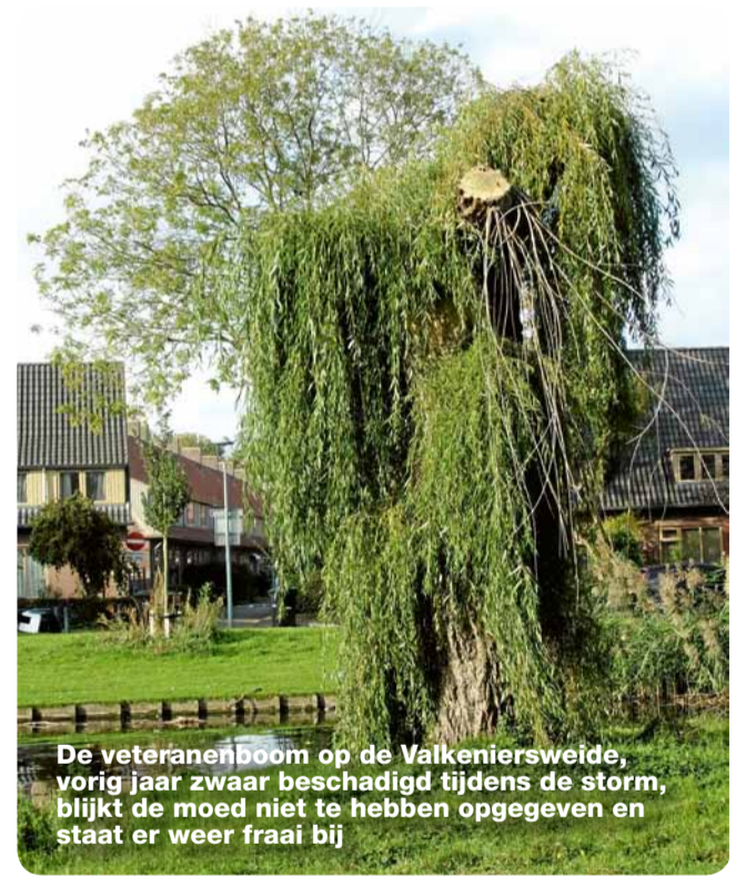
De veteranenboom op de Valkeniersweide, vorig jaar zwaar beschadigd tijdens de storm, blijkt de moed niet te hebben opgegeven en staat er weer fraai bij